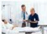
ÁREAS DE ATENCIÓN A PACIENTES