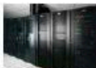
CENTROS DE DATOS