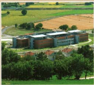
Ospedale comprensoriale di Gubbio e Gualdo Tadino

EDIFICI E TECNOLOGIE PER LA CURA, L'ASSISTENZA E LA RIABILITAZIONE