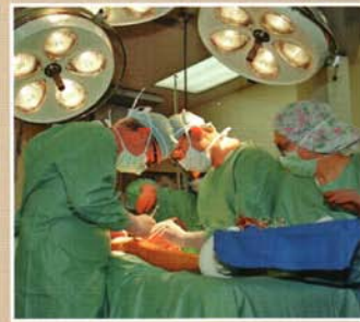
L'impiantistica per i blocchi operatori