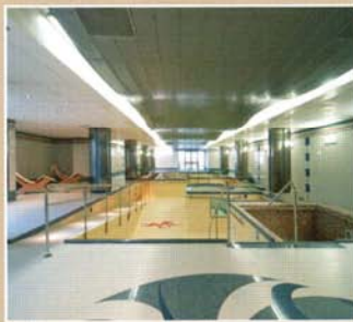
Centro di assistenza e riabilitazione, San Giovanni La Punta (CT)